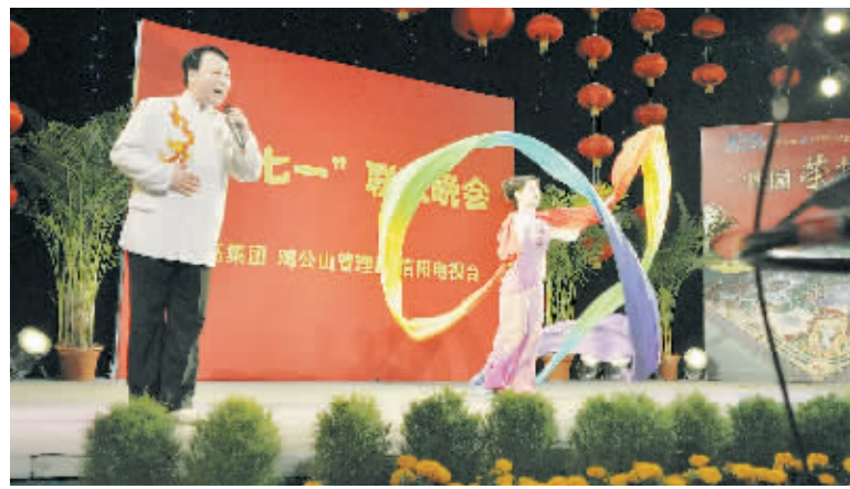
在中国共产党成立89周年之际,志高集团、鸡公山管理区、信阳电视台联合举办“七一”联欢晚会,庆祝党的生日。图为演出场景。