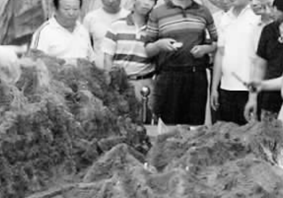
市司法局 开展“中原清风杯”廉洁从政法规制度知识测试活动

求认真组织,精心安排,周密部署,切实把这项工作做实做好。测试前,该局纪检组专门召开会议研究部署参加测试人员的范围、测试的方式等具体工作,结合广大党员干部前期政治理论学习的状况,发放了学习辅导资料,引导党员干部重温 and 掌握《廉政准则》等党纪政纪法规,要求全体党员干部做学习的表率、测试的表率、贯彻的表率。