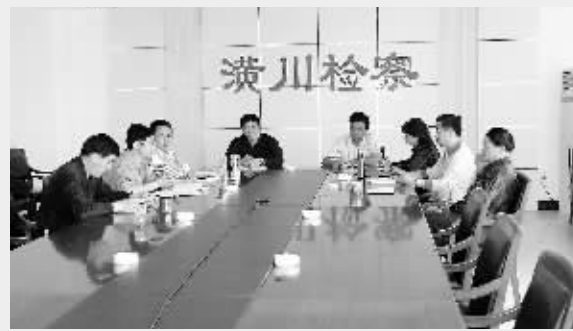
近日,潢川县检察院召开了部分人大代表、政协委员和人民监督员参加的座谈会,广泛征求他们对反法履职工作的意见和建议。