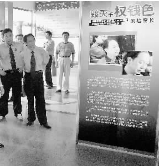
“七一”前夕,淮滨县检察院组织24名青年党员到安阳林州市红旗渠参观学习。在两天的参观学习中,“自力更生、艰苦创业”的“红旗渠精神”使青年党员的思想受到了洗礼,精神得到了升华。因为该院青年党员参观红旗渠分水岭纪念馆时的情景。

家庭温暖的劳教人员谈心并提供心理咨询服务,稳定其思想。二是丰富节日文体活动。端午节当天,组织劳教人员收听、收看广播、电视节目,各大队之间进行篮球、乒乓球、象棋等比赛,极大地丰富了劳教人员的节日生活。三是丰富端午节伙食。专门购买了猪肉、鸡蛋和不同口味的粽子,改善劳教人员的伙食。四是开通亲情电话。为表现好的劳教人员开通亲情电话,让他们诉说对亲人的牵挂和自己的表现。五是写一封家书。开展“一封家书”活动,让劳教人员用写信的方式抒发对亲人的思念之情,稳定他们的思想情绪。