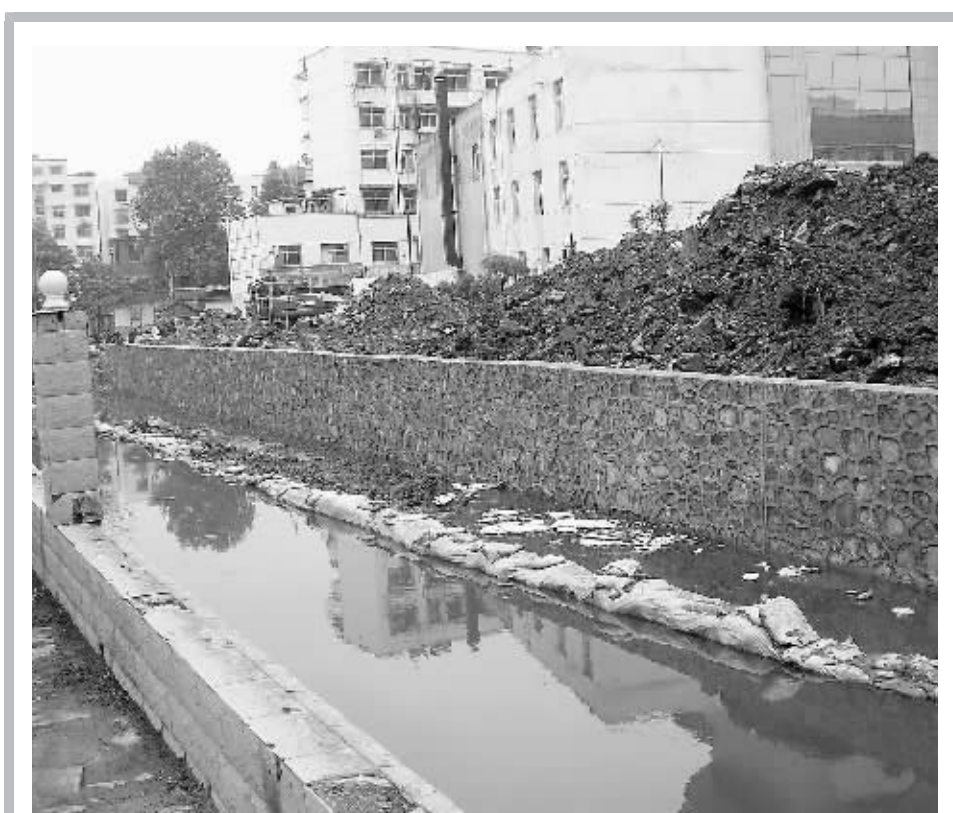
我市的内河虽经多次整治,乱倒脏水、乱扔垃圾的现象仍然存在,内河河道卫生状况差,而且容易发生堵塞,造成城区内涝。夏季已经到来即将进入汛期,日前,我市市政工程专业安排技术人员对城区内的下水道进行了清淤,同时,内河流经处各辖区责任单位也组织人员对市内的河道进行了拓宽改造,确保汛期内河行洪畅通,避免市区内涝的发生。图为正在进行拓宽改造的内河。

食糖价格上涨。食糖平均零售价格为6.4元/公斤,上涨0.79%。食盐、奶类价格稳定。