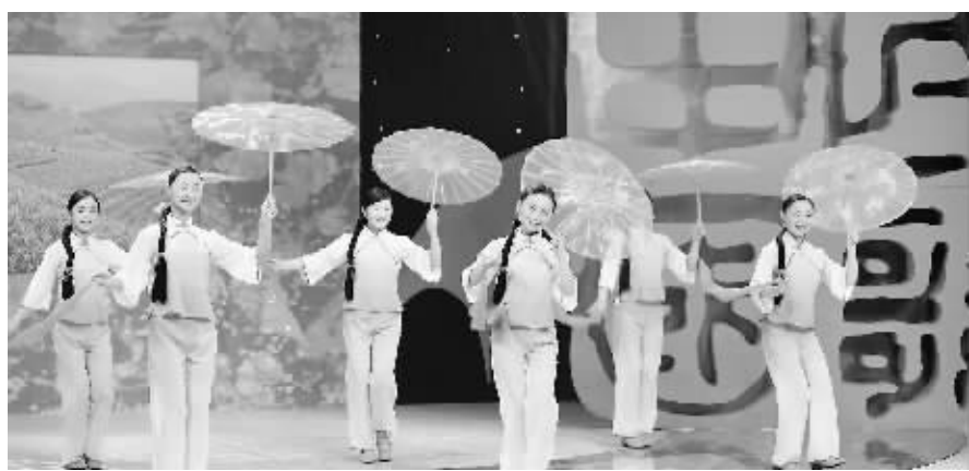
图为央视节目录制现场