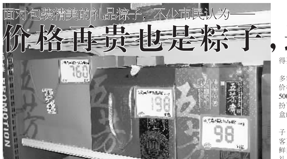
图为包装精美但价格奇高的粽子礼盒

郭介绍,锐之旗公司将于近期在全省范围内开展“百度十亿助力河南企业电子商务提速行动”,力争在三至五年内投入10亿元为河南省30万家中小企业提供电子商务建设服务,提速河南企业电子商务发展,使得我省的企业在电子商务时代,抢占未来发展的战略制高点。