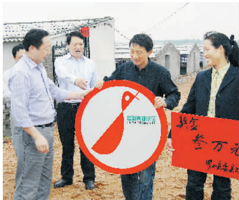
图为华英鸭养殖小区标识发放时的情景。