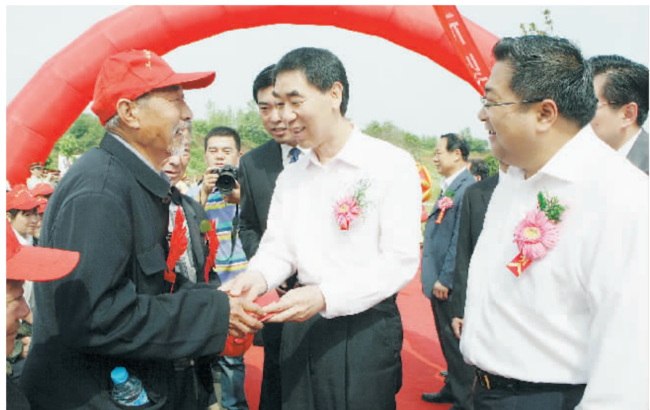
市委书记王铁向信阳工业城农民代表发放养老金存折和领取证。