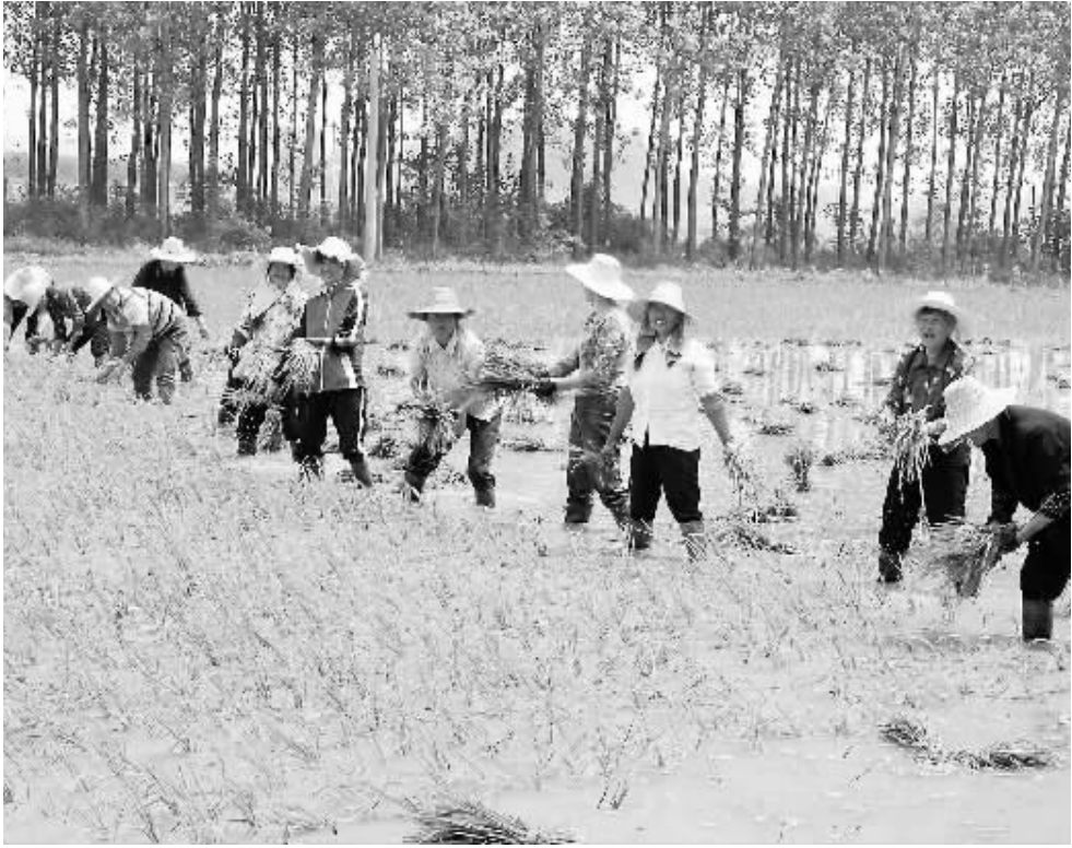
6月6日上午,潢川县魏岗乡店村女子插秧钟点工正在为村民抢插早秧。这些钟点工都是该村的妇女,她们按时计价,既保障了农忙时插好秧,也让在外务工人员能够安心工作。

急救知识竞赛和“安全河南”杯第二届全省安全生产知识竞赛等。六是启动安全生产应急演练周活动。七是组织开展安全生产大检查。八是在《信阳日报》开辟专版,以“自然、和谐、安康”为主题,组织省内外罗山籍画家回信阳进行采风、创作,以绘画艺术的形式宣传安全生产的宗旨,营造氛围。