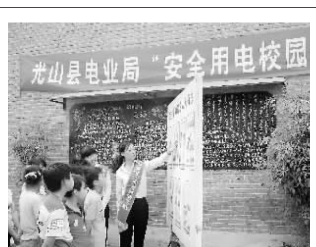
6月1日下午,光山电业局青年志愿者来到斛山乡陈大院小学,给孩子们讲解安全用电常识,并送去学习用具、安全用电知识手册,与孩子们分享“六一”儿童节的快乐。