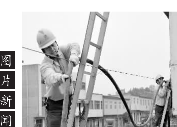
为确保迎峰度夏电网安全稳定运行,5月27日,信阳供电公司和平桥区十组用户进行线路改造,提高对该区域供电能力。李斌 摄

为了防止“盾牌行动”中窃电户通风报信,这一次,30多名电力稽查人员分为两组,从村庄两头同时进入,逐条线路、逐个计量表箱进行核查,寻找蛛丝马迹。经过细心核查,共查出有5户窃电户,其中有3户通过挂钩在主线路上窃电,一户绕过电表窃电,一户不经申请报装,自行安装电表用电。经过现场取证,稽查人员向窃电户下达《窃电电能通知书》,要求他们到市政府保护电力办公室听候处理。 随后,稽查人员又分成三路来到平桥区吃城进行核查,没有发现窃电行为。