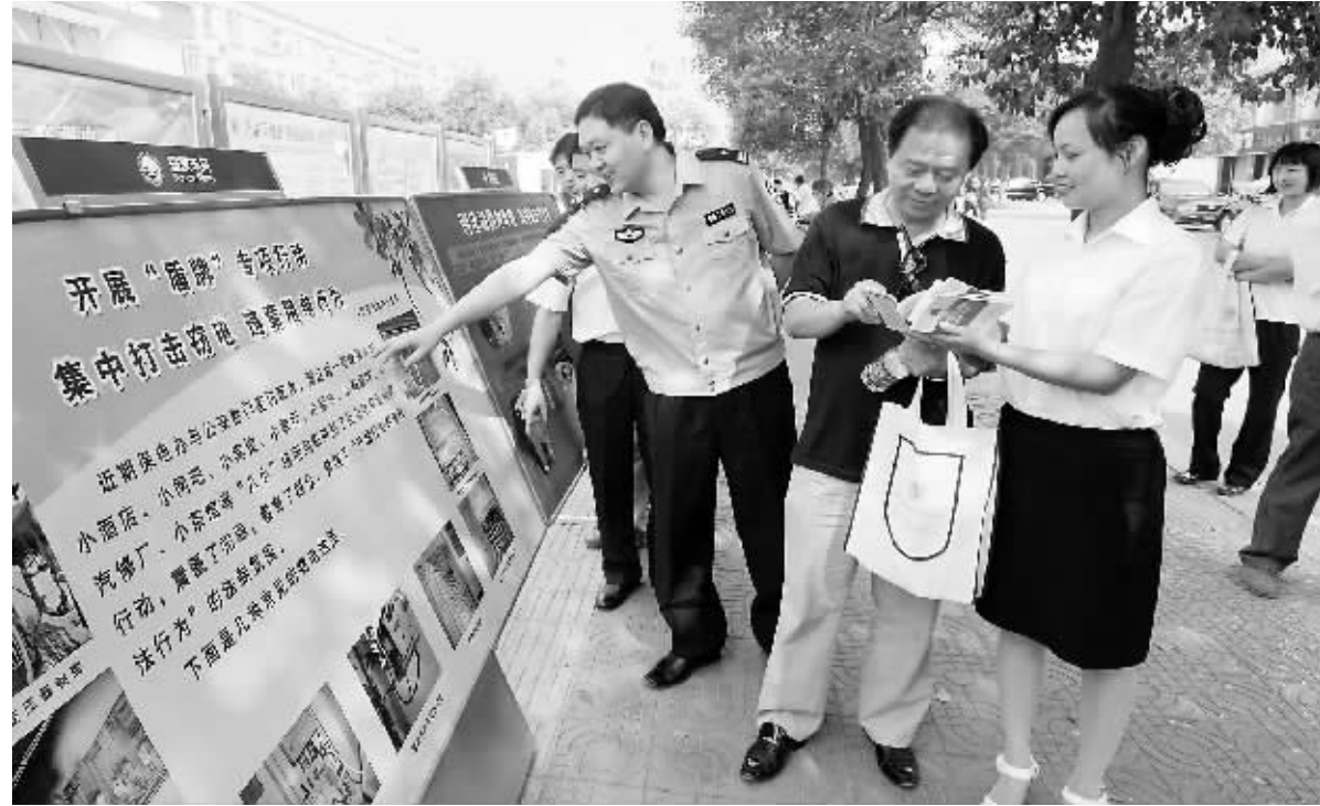
近日,信阳供电公司工作人员走上街头,向广大市民散发宣传资料,宣传电力设施保护法律法规,为反窃电“盾牌行动”营造浓厚氛围。

司向社会公布举报电话,24小时收集举报线索,对举报情况属实的,给予奖励。充分利用营销管理系统、用电信息采集系统、负荷监控、配变监测、集中抄表、现场检测等手段,对窃电嫌疑户、违章用户进行调查摸底,并逐户登记造册,确定重点打击对象和治理区域。建立地区间协作和信息共享机制,对在行动过程中发现的重特大及高科技窃电案件或跨省、市、县作案的重大线索,及时通报案情信息,统一协调,建立跨省、市、县办案机制,绝不放过任何一条线索和一个窃电嫌疑户。