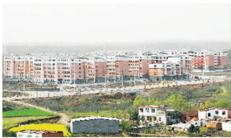
图为信阳工业城建设的可提供1万人入住的大型社区。

编者按:日前,市委书记王铁带队对六个管理区、开发区推进城乡一体化工作进行实地观摩后强调,六个管理区、开发区一定要带好头,当好示范,做出榜样,使农村改革发展综合试验区建设取得更好的成绩。根据市委领导的要求,本报今日起陆续推出特别报道,对六个管理区、开发区及相关部门推进城乡一体化工作进行跟踪报道。