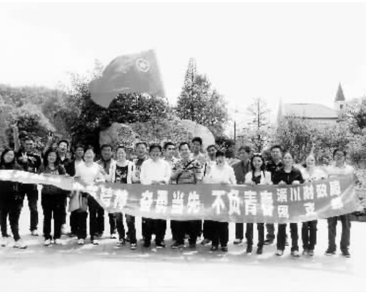
日前,潢川县财政局团支部组织机关干部团员青年、入党积极分子、青年文明号负责人及新老团干到信阳波尔登森林公园开展“坚定理想信念、永葆青春”主题教育活动,进一步增强团组织的凝聚力和战斗力,提高了大家的团队意识、奉献意识和干事创业的积极性、主动性。

大力实施根亲招商和回归经济两大工程,着力开展品牌招商、亲情招商。以根亲文化节为载体,以“唐人故里、闽台祖地”为品牌,以闽、台、东南亚等与固始有根亲渊源关系的重点区域和重要人物为重点,不断创新招商引资工作方法,拓展工作触角,取得良好成效。何氏、尹氏、施氏等海内外宗亲纷纷投身该县城建、教育、文化等事业发展。目前,该县返乡人员投资100万元以上的企业已突破500家,提供就业岗位近10万个,回归经济已渗透到固始经济和社会事业发展的各个方面,成为县域经济发展的重要力量。 与此同时,该县统战系统不断创新招商方式,在进一步抓好小分队招商、主题招商、展览招商的同时,积极推进以企业为主体的专业招商、委托招商、网络招商,以招商等简便快捷的招商活动,通过内整资源、外引项目,推动了一批产业集聚园区建设。