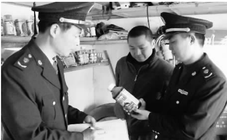
连日来,鸡公山工商分局加大对种子、肥料、农药、农膜等重点农资的检查力度,特别严查经营甲胺磷、久效磷等5种高毒农药的违法行为,切实维护农民利益。图为执法人员正在一农资经营店检查。

据了解,考核组一行将通过查看相关材料、实地检查重点企业等形式对我市节能目标完成情况进行全面考核,并向我市反馈考核意见。