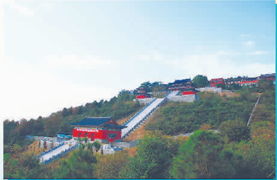
观音山 电话: 13569720928