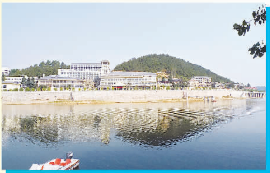
茗阳汤泉 电话: 7888008