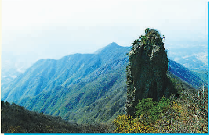
金刚台 电话: 7399064