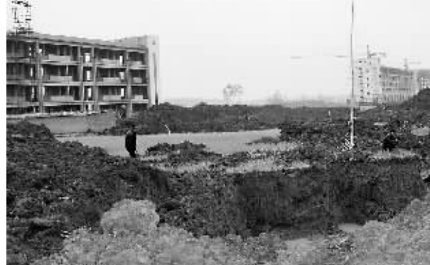
淮滨县加快教育园区建设,规划新建县职业技术教育中心、十二年一贯制学校、特殊教育学校、寄宿制中学、全托幼儿园各一所,并配套综合体育健身场馆、学术交流中心等公共设施。该教育园区占地550亩,投入资金9000多万元。图为繁忙的施工工地。