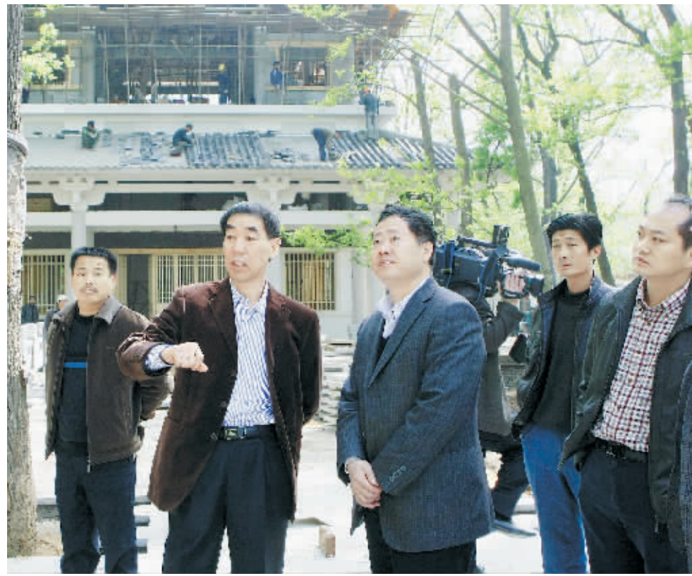
4月16日上午,市委书记王铁深入望湖轩、聚贤祠、申伯楼、琵琶台、平山塔、河洲榭等浙河新八景建设现场,检查工程建设进度。王铁强调,一定要科学施工,快速推进。同时,要确保工程质量,确保工程高标准、高品质。他要求,先期建设的几项工程在茶文化节前完成主体建设和亮化工作,其他工程在5月底前完工。当日上午,王铁还察看了羊山新区新六大街北段建设情况。图为王铁检查申伯楼建设时的场景。

李广胜也对青山纯电动汽车项目建设提出了要求。李广胜指出,经济社会要想快速发展,就必须要有好的项目;有好的项目,就必须敢“吃螃蟹”;敢“吃螃蟹”,就必须要有敏锐的目光;敏锐的目光来自准确的分析和判断。纯电动汽车是解决能源危机、环境污染的有效载体,生产纯电动汽车符合世界产业发展方向,国家支持。作为一项基础性产业,纯电动汽车生产对我市产业发展有强大的推动作用。因此,要增强紧迫感和责任意识,有一股子闯劲、干劲、拼劲,抢抓机遇干成事。