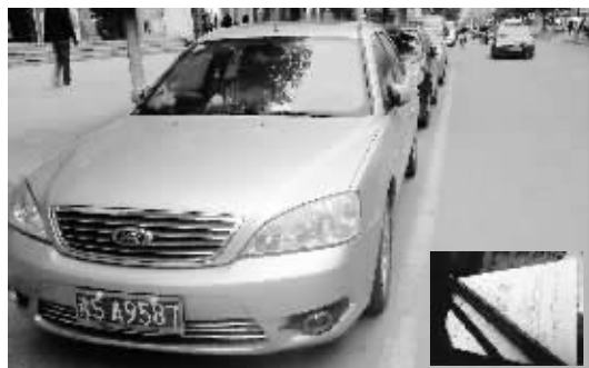
这辆被贴罚单的车并没有停在停车位外