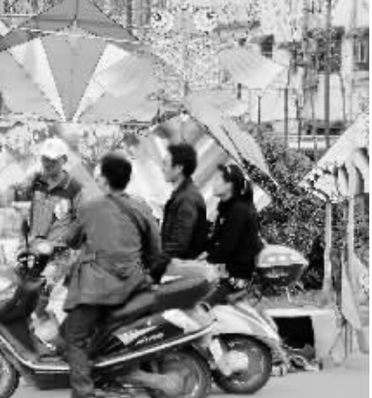
放风筝是许多市民喜爱的户外活动。随着春季来临,风筝开始畅销。一位卖风筝的妇女说,近期最高峰时,她一天可卖出近百个风筝。图为市民正在选购风筝。

蔬菜价格上涨。目前,蔬菜类平均批发价格为3.94元/公斤,较前期上涨4.79%。在被监测的18种蔬菜中,4种价格下跌,9种价格上涨,5种价格持平。其中,价格下跌的蔬菜品种有茄子、生姜、芹菜、生菜,跌幅分别为2.35%、2.86%、4.76%、7.14%;价格持平蔬菜品种是黄瓜、西红柿、蒜头、洋葱、冬瓜;其余蔬菜品种全部上涨,涨幅在4.17%至28.57%之间。一些越冬蔬菜进入尾声,上市量减少,市场供应趋紧,价格反弹;刚上市的蔬菜,由于产量小,不能满足需求,所以价格上涨。预计随着气温逐渐回升,蔬菜品种上市量逐步增大,我市蔬菜价格将会稳步回落。