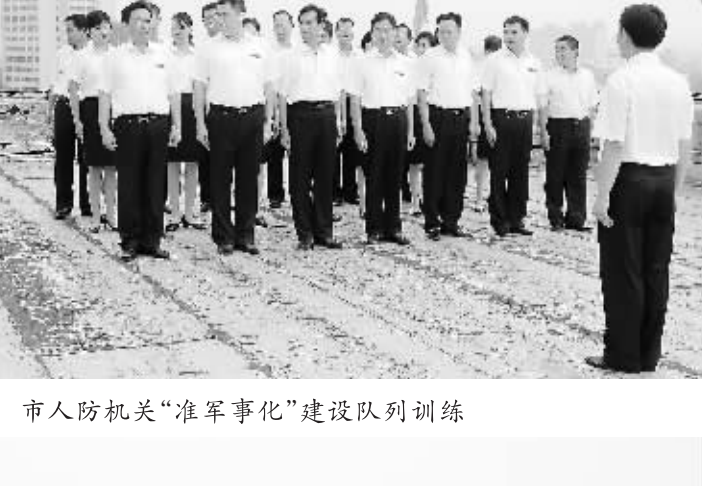
市人防机关“准军事化”建设队列训练