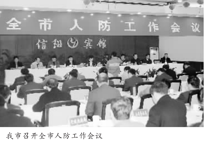
我市召开全市人防工作会议