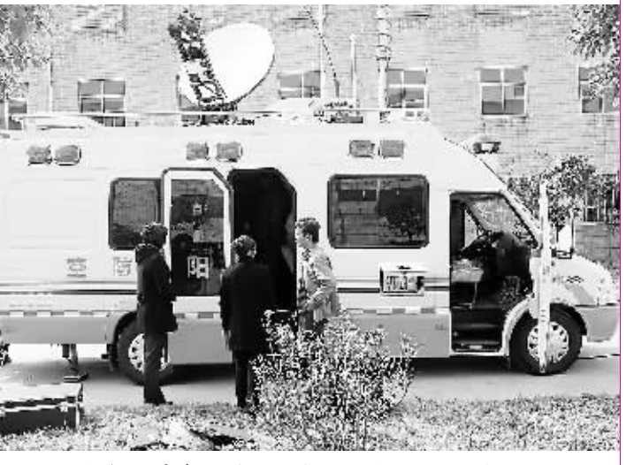
通信技术人员在开展人防机动指挥通信训练

高效”要求为目标,积极打造“勇于挑战、乐于奉献、善于创新、敢于争先”的人防精神,人防队伍素质有了新的提升,三是县人防机构进一步健全,各县区人防机构、编制和办公场所目标,县人防工作全面展开,达到了组织健全、人员基本落实的目标,有力地推动了人防工作的开展。 上述成绩的取得,得益于省人防办的精心指导和大力支持,得益于市委、市政府、军分区的正确领导和亲切关怀,得益于市直有关部门的相互配合和有力帮助,得益于社会各界人士的关注和支持,得益于全市人防系统干部职工的奋力拼搏。 几年来的实践证明,加快人民防空事业发展,必须坚决贯彻执行中央关于人民防空建设的方针政策,切实形成党政军共同领导、管理人民防空工作的合力;必须坚持依法建设,依法管理,扎实推进人民防空法律法规的贯彻落实;必须坚持与时俱进,改革创新,积极探索人防经济下人民防空发展的新思路、新举措、新办法;必须坚持以军事斗争人民防空应急准备为牵引,把重点与整体、当前与长远、平时与战时有机结合起来;必须坚持以人为本,大力建设为根本,培养造就高素质的人民防空干部和专业队伍。