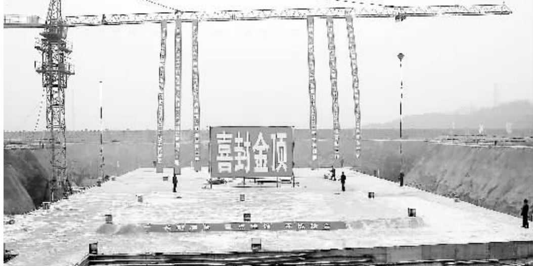
市0406人防工程土建主体封顶