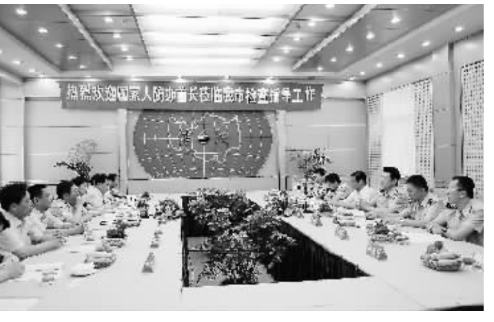
国家人防办李福局长莅临我市检查指导人防工作