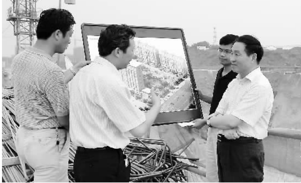
副市长李水(右一)在听取市0406人防工程建设情况汇报