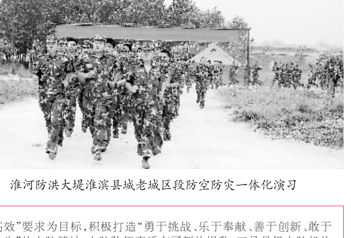
淮河防汛大堤淮滨县城老城区段人防一体化演习

高效”要求为目标,积极打造“勇于挑战、乐于奉献、善于创新、敢于争先”的人防精神,人防队伍素质有了新的提升,三是县人防机构进一步健全,各县区人防机构、编制和办公场所目标,县人防工作全面展开,达到了组织健全、人员基本落实的目标,有力地推动了人防工作的开展。 上述成绩的取得,得益于省人防办的精心指导和大力支持,得益于市委、市政府、军分区的正确领导和亲切关怀,得益于市直有关部门的相互配合和有力帮助,得益于社会各界人士的关注和支持,得益于全市人防系统干部职工的奋力拼搏。 几年来的实践证明,加快人民防空事业发展,必须坚决贯彻执行中央关于人民防空建设的方针政策,切实形成党政军共同领导、管理人民防空工作的合力;必须坚持依法建设,依法管理,扎实推进人民防空法律法规的贯彻落实;必须坚持与时俱进,改革创新,积极探索人防经济下人民防空发展的新思路、新举措、新办法;必须坚持以军事斗争人民防空应急准备为牵引,把重点与整体、当前与长远、平时与战时有机结合起来;必须坚持以人为本,大力建设为根本,培养造就高素质的人民防空干部和专业队伍。