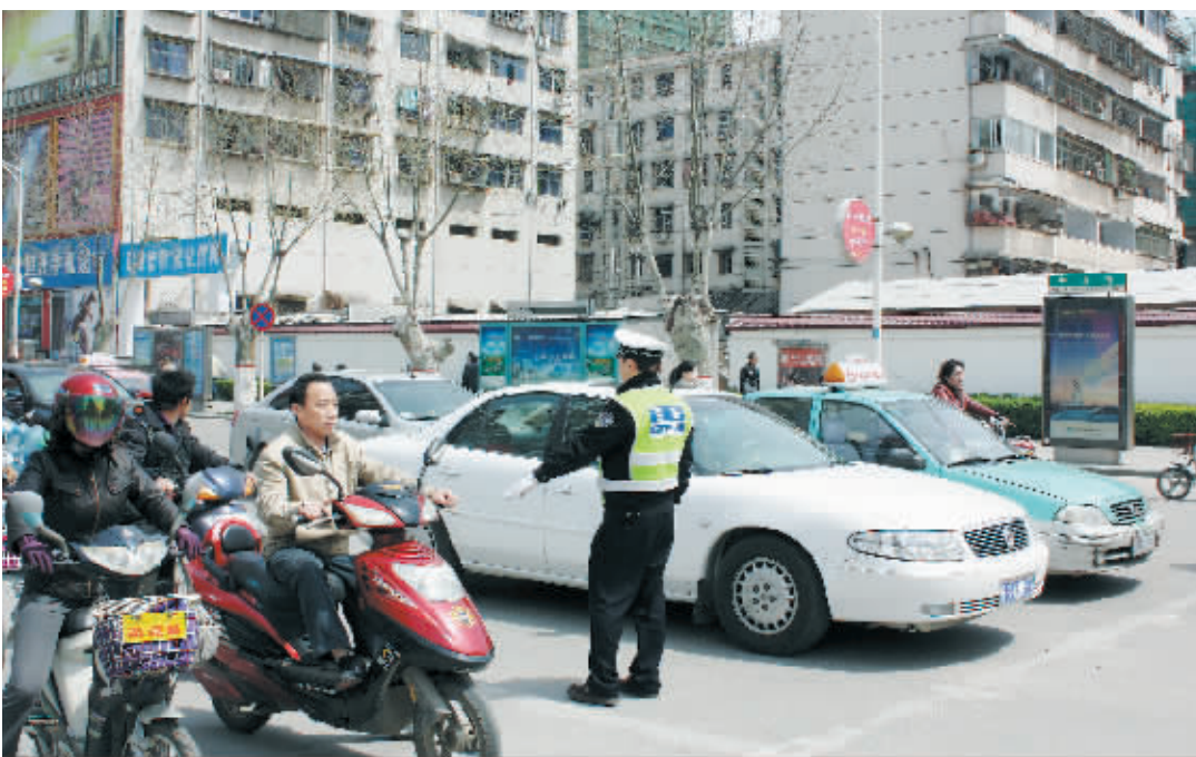
4月7日上午12时，交警正在市区中山路口认真执勤。经过近期集中整治，我市中心城区交通秩序有了较大改观，市民遵守交通法规的意识明显增强。