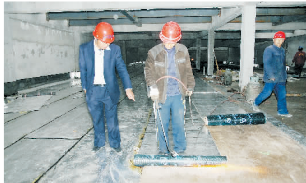
为了迎接信阳第十八届国际茶文化节的到来，近期，承建“百花之声”的施工企业职工们夜以继日奋战在工地上，力争早日完成施工任务。图为工人正在进行建筑防水施工。

据悉，这次实施的《信阳市平桥区新型农村社会养老保险工作方案》，是在全区范围内先行试点一年的基础上，根据国务院国发(2009)32号《关于新型农村社会养老保险试点的指导意见》、省政府豫政(2009)94号《关于开展新型农村社会养老保险试点的实施意见》，结合本地实际，并聘请专家论证的基础上确定的。该区实施的新型农村社会养老保险遵循“保基本、广覆盖、有弹性、可持续”的原则，筹资和待遇标准与当地经济发展及各方面承受能力相适应，权利与义务相对应，政府引导与农民自愿相结合，采取社会统筹与个人账户相结合的基本模式和个人缴费、集体补助、政府补贴相结合的筹资方式。缴费分5个档次：每年100元、200元、300元、400元、500元。参保农民根据收入情况任意选定，政府为每位参保人员设立终身专项个人账户，并按金融机构人民币一年期存款利率计息。地方财政对参保缴费人员实行每人每年补助30元，对重度残疾人，由政府为其代缴全部最低标准的养老保险费，对烈属、领证的农村独生子女及父母和政策内双女结扎户的双女及父母，区政府给予每人每年10元的补贴。此项保险以今年4月30日为基准日，累计缴费不超过15年。