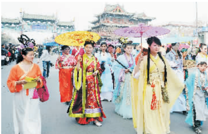
4月5日,一些扮作北宋汴京市民的演员行走在开封的街道上。当日,清明节民俗文化大巡游活动在开封龙亭广场启动。