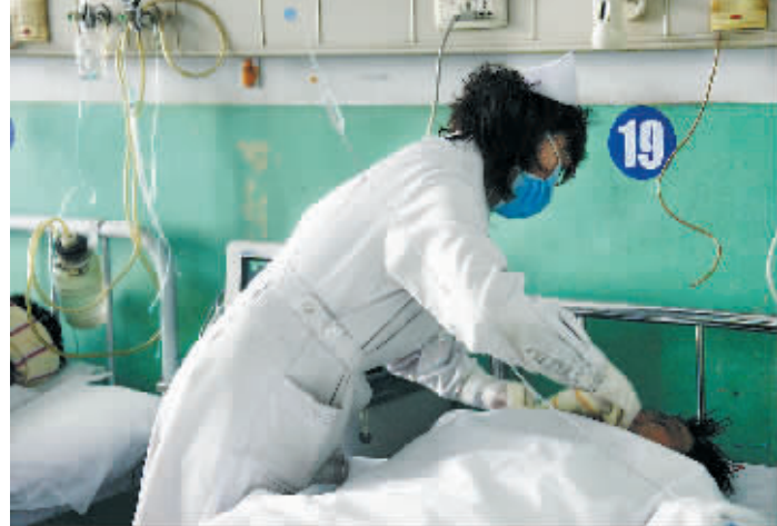
4月5日,医疗专家在为一位矿工治疗。

且倾角25度,工作最大断面只有约30平方米,电缆、变压器、水泵都要进,其中最重的泵重近14吨,全靠肩扛人抬,而且要把这台泵分拆后运到井下再进行安装,仅安装这一台泵就花去了七八个小时。4个人抬一节重200公斤左右的泵管,从人站在上面都有下坠感觉的25度斜坡抬下去,困难可想而知。突发的水瞬间涌出,使施