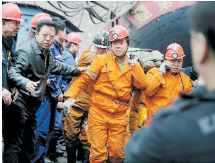
4月5日,救援人员将获救矿工抬出井口。

4月5日,零时30分左右,王家岭煤矿透水事故第一名被困人员被4名救援人员平稳地抬出矿井口,现场上千名群众欢声雷动。零时40分开始,第一批上井