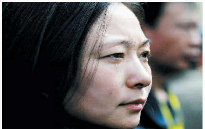
4月5日,一名女记者看到获救矿工陆续升井,流下眼泪。

新华社山西河津4月5日电 到记者18时发稿时,有36名获救工人正在位于山西河津市的山西铝厂职工医院接受救治。目前,这36名工人生命体征平稳。救治医生介绍,这36名工人是分两批到山西铝厂职工医院接受救治的。据医疗专家讲,首批9名工人的病情要比后来的工人重一些,可能是因为他们井下所处的环境不同。目前,这36名工人的生命体征平稳。记者了解到,这36名工人的一些共同症状是水电解质紊