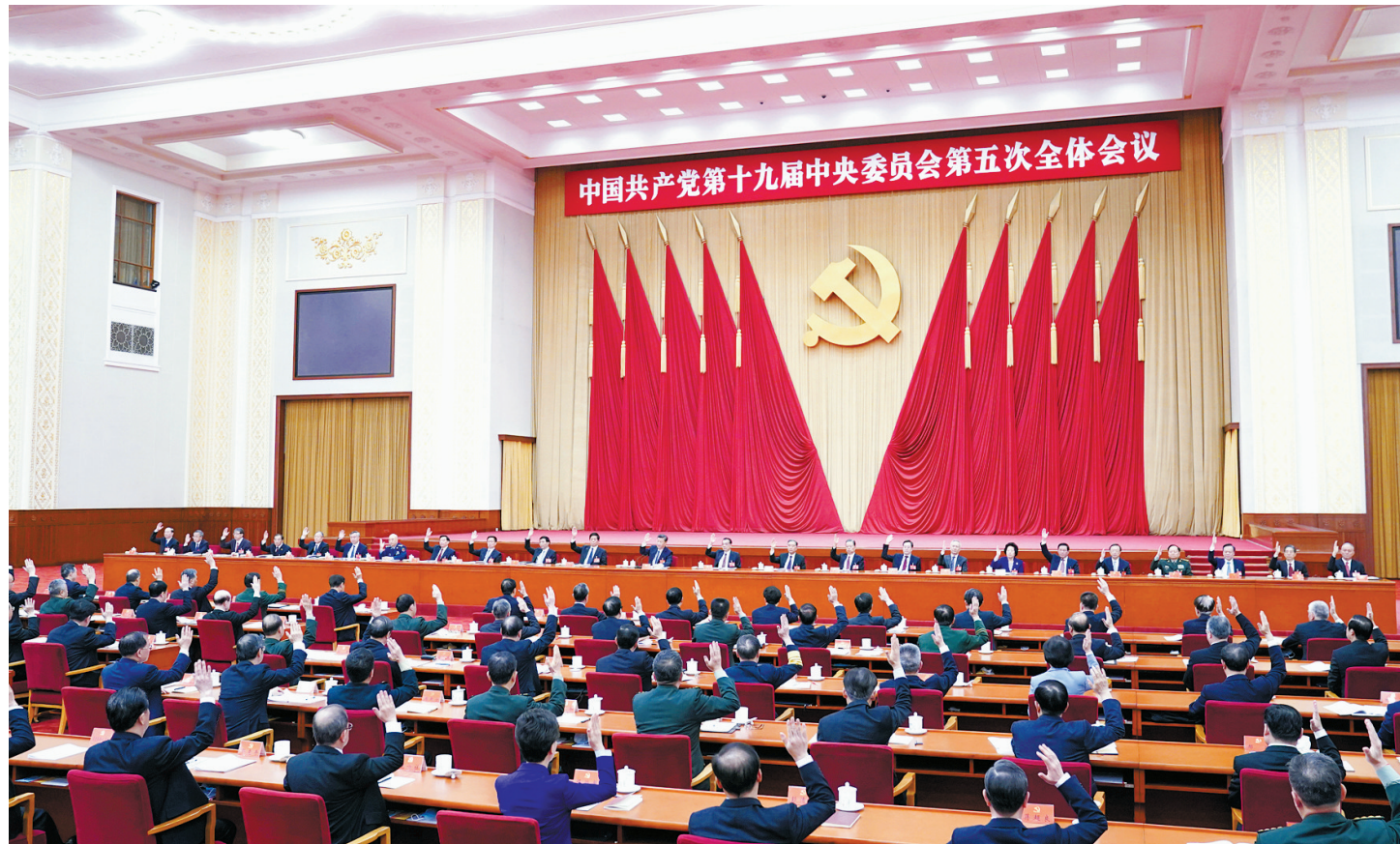
中国共产党第十九届中央委员会第五次全体会议,于2020年10月26日至29日在北京举行。中央委员会总书记习近平作重要讲话。